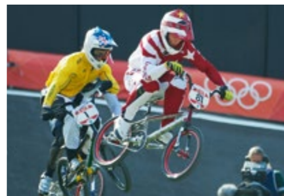
Champion olympique de BMX Māris Štrombergs

Māris Štrombergs, double champion olympique et premier vainqueur de la médaille olympique en BMX, est actuellement l'un des athlètes les plus populaires de Lettonie. Le joueur de tennis Ernests Gulbis est récemment devenu le premier letton à se classer parmi les 10 meilleurs joueurs du monde. Ces dernières années, le beach volleyball est devenu très populaire en Lettonie. Rien d'étonnant à ce que Jānis Šmēdiņš et Mārtiņš Pļaviņš aient gagné la première médaille de bronze lettonne en beach volleyball aux JO d'été 2012 à Londres. N'oublions pas que la Lettonie est un pays de sports d'hiver : skeleton, luge, hockey sur glace sont toujours très populaires.