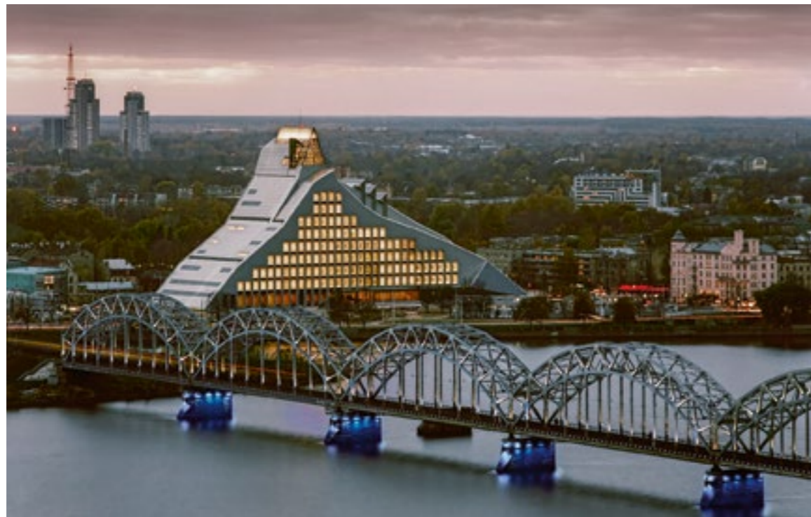
Bibliothèque nationale de Lettonie